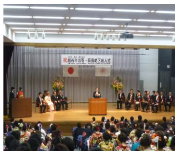
越谷市・越谷市教育委員会/越谷市出羽・荻島地区成人式実行委員会

「新成人の皆さん、その若い力を思う存分に発揮して、未来に向かって大きく羽ばたいてください」